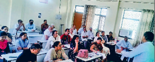
झज्जर। प्रशिक्षण के दौरान नव पदोन्नत प्राचार्यों को संबोधित करते हुए प्रशिक्षक।