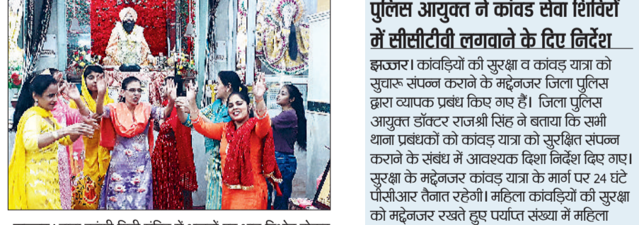
झज्जर। बाबा कांशी गिरी मंदिर में भजनों पर भाव विभोर होकर नृत्य करती महिलाएं।