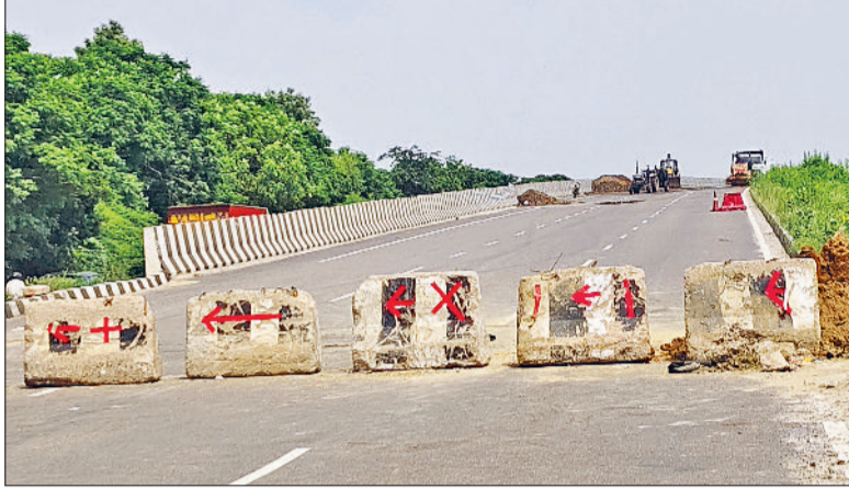
बहादुरगढ़। नया गांव चौक पर बने फ्लाईओवर को अवरुद्ध कर जारी मरम्मत का काम।