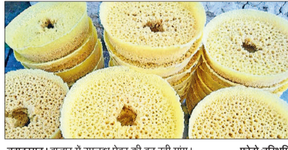
बहादुरगढ़ । बाजार में उपलब्ध घेवर की बढ़ रही मांग।

सावन का मौसम अपनी खूबसूरती बिखरने को तैयार है। इस मौसम में अगर मिष्ठान की बात की जाए तो जेहन में घेवर का नाम सबसे पहले आता है। इसके आगे कोई भी मिठाई फनी पड़ जाती है। स्वीट शॉप पर अन्य मिठाइयां पूरे साल भर मिलती हैं, लेकिन घेवर केवल सावन के दौरान ही बनता है। घेवर मिठाई के साथ संस्कृति का भी रूप ले चुका है। इसे खासकर तौर पर उत्तर भारत